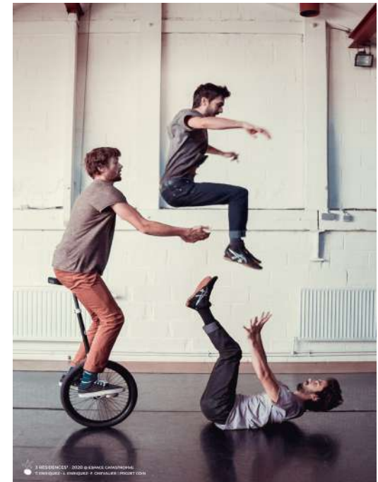
Image et poésie, dont le corps est le principal outil laissant découvrir un univers quelque peu décalé. »

Au bord de l'absurdité, les pratiques des jeux icariens et selle du monocycle sont étroitement liés. Trois corps voguant entre élégance et maladresse avec un monocycle utilisé dans tous les angles, à se demander s'ils ne roulent pas sur la tête.